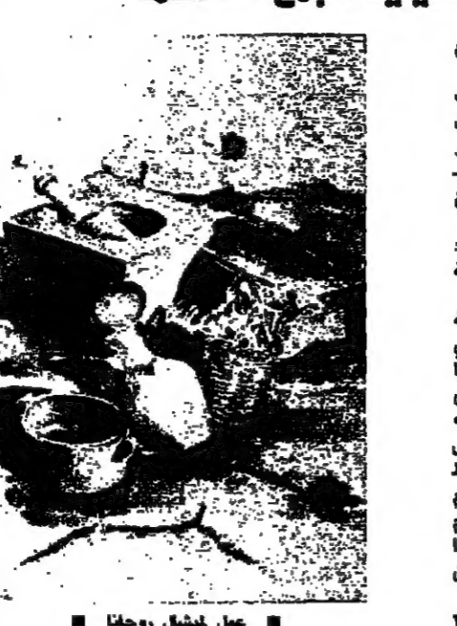
عمل ليشل روحنا

مررة ثالثة، يتكرر اللقاء المفوق على اسم العمل. فنون تشكيلية، آلات موسيقية، حرف شبيهة، فروع وفروض وأشياء أخرى كثيرة تشكلت عصب المعرض السنوي الثالث، «الفرق» و«الربيع» في الجمع المسلي بورتيميليو - الكسليك من أول حزيران الجاري إلى التاسع منه.